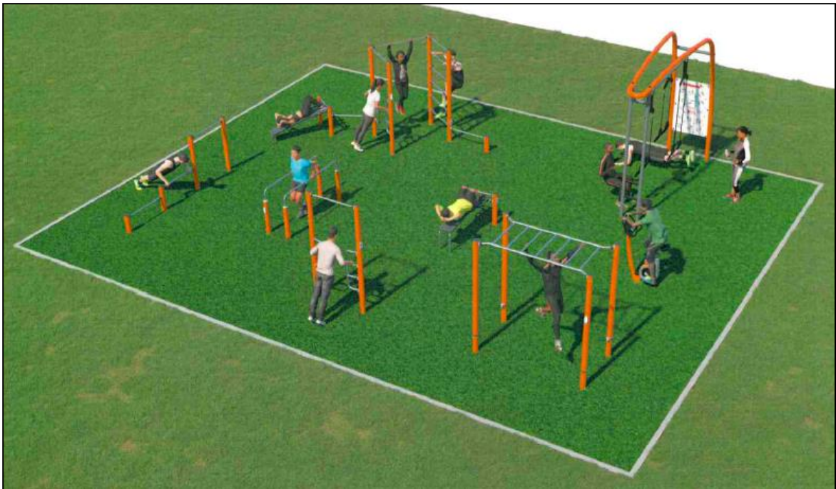
Sopra_ Esempio di area fitness all'aperto principalmente isotonica.

Le attrezzature ipotizzate per l'allestimento dell'area (ad esclusione della porzione centrale la quale sarà adibita a percorsi per attività a corpo libero), vengono previste prevalentemente con strutture portanti in alluminio, fissate a terra secondo il sistema previsto dal produttore, ed eventualmente dotate di pavimentazione anti urto e anti trauma.