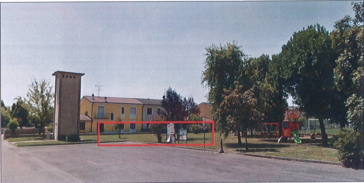
Sopra_ vista generale della porzione di area individuata per la proposta di cui alla LINEA DI INTERVENTO n. 1

Attualmente l'area proposta, non presenta particolari presenze di barriere architettoniche, ad esclusione di un piccolo dislivello tra l'area stessa e la strada (dato dal cordolo di contenimento), di altezza pari a poco più di cm 10, facilmente superabili potendo utilizzare la rampa in cemento esistente, ovvero prevedendo la realizzazione di una ulteriore rampa per accesso disabili, di pendenza non superiore all'8%, ma bensì compresa tra il 4 e il 6%, così come consigliato dalla normativa vigente in materia.