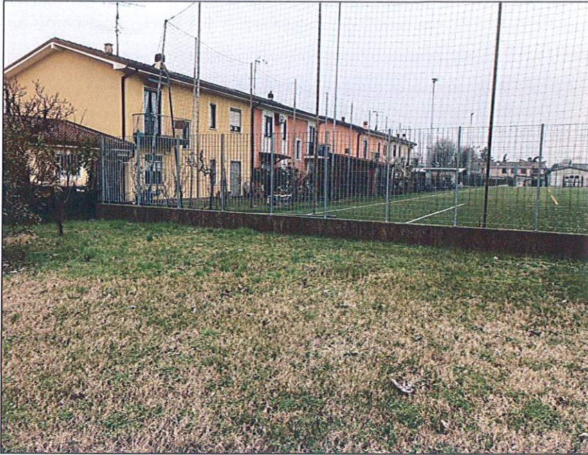
Sopra_ vista della porzione Sud-Est dell'area di Via Appennini in Asola (Mn), a ridosso del campo da calcio comunale e dell'impianto sportivo.

L'area in se risulta essere completamente pianeggiante e libera da impedimenti, facilmente accessibile ad un gran numero di possibili utenti e utilizzatori finali, tra cui anche bambini e diversamente abili, e non si trova in stato di abbandono, in quanto viene eseguita regolare manutenzione da parte degli addetti comunali esterni.