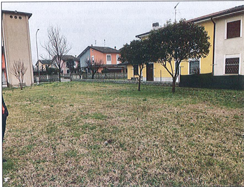
Sopra_ vista della porzione Sud-Ovest dell'area di Via Appennini in Asola (Mn).